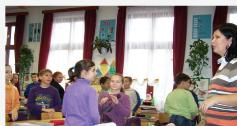
Bemutató óra a 4. osztályban

sok szép eredményt hoztak hazájukba, melyet az iskolánk hírnevét dicsőítették. Még egy első kislány is készült rá mesével! Nagyon ügyes volt minden mesemondó, a szépirók és meseírók is szép jutalmakat kaptak!