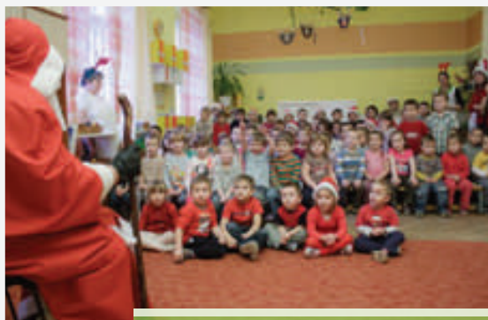
A Mikulás nálunk is járt

kozás. Óvodánkban régi hagyomány a farsangozás . Minden csoport külön készül erre, ahol a gyerekek jelmezbe öltöznek, vidám műsort adnak és utána szüleikkel, együtt táncolnak, szendvicset és fánkot esznek. Az idei farsangok is jól sikerültek! Márciusban már nemcsak a húsvétra készülődünk, hanem előre tekintve már az ősze is. Mivel az óvodai beíratások 2013. 04. 08-án és 09-én lesznek, 03. 09-én, szombaton Ovi – nyitogatót tartottunk a még most bölcsődés gyerekeknek és szüleiknek. Itt a szülők megismerkedhettek óvodánkkal, az itt dolgozókkal, beszélgethettek a leendő óvó nénikkel, a gyerekek pedig játszóházban játszhattak. Virágvasárnapon a piac rendezésében színvonalas műsort adunk a gyerekekkel együtt.