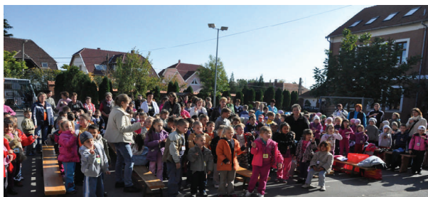
Suliváró a „Szegediben”

Januárban játszóházat rendeztünk a leendő elsősöknek, ahol a 4. osztályos tanulók a Noé bárkája című történetet adták elő. Nagyon élveztük a felkészülést, és szívesen szerepeltünk a „kicsik” előtt. A műsor után farsangi kézműves foglalkozásokkal vártuk a nagycsoportos gyerekeket. Változatos technikákkal Noé bárkájának