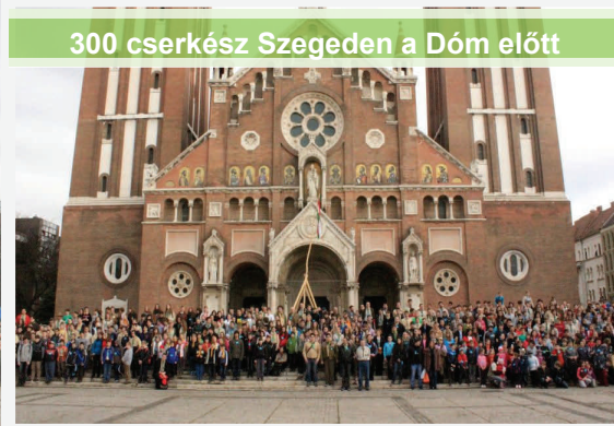
300 cserkész Szegeden a Dóm előtt