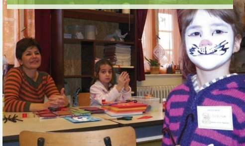
Játszóház a Karacsban